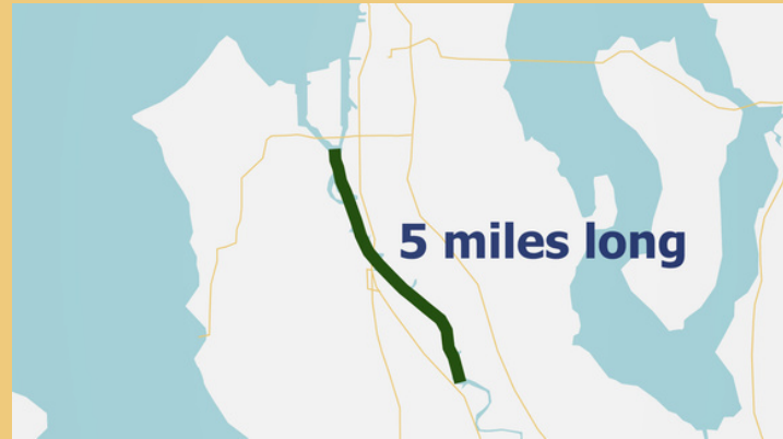
Địa điểm Superfund Đường Thủy Hạ lưu Sông Duwamish dài 5 dặm.